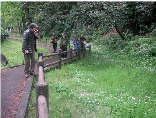
ニリンソウ自生地