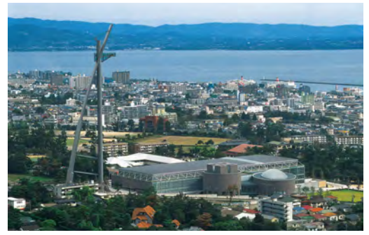
会場ビーコンプラザと別府市内

デジタル時代・環境負荷軽減のため、情報発信はWebをメインに行います。 6月中旬に宿泊施設専用予約サイトを開設予定ですが、会場までの交通手段や宿泊施設は各自で手配していただくことになります。 上記スケジュールをご確認の上、お早めのご予約をお願いいたします。