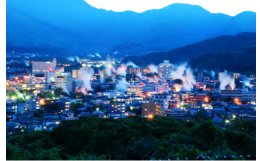
湯けむり展望台からの眺め