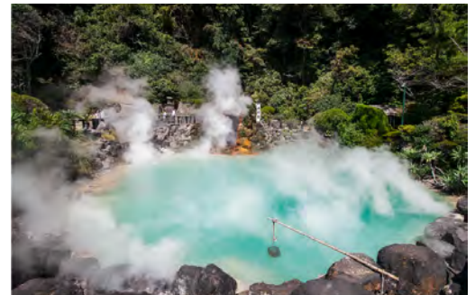
別府地獄めぐり(海地獄)