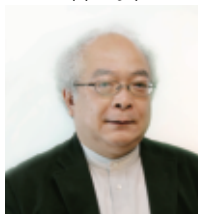
西方 里見 氏 (有) 西方設計・建築家