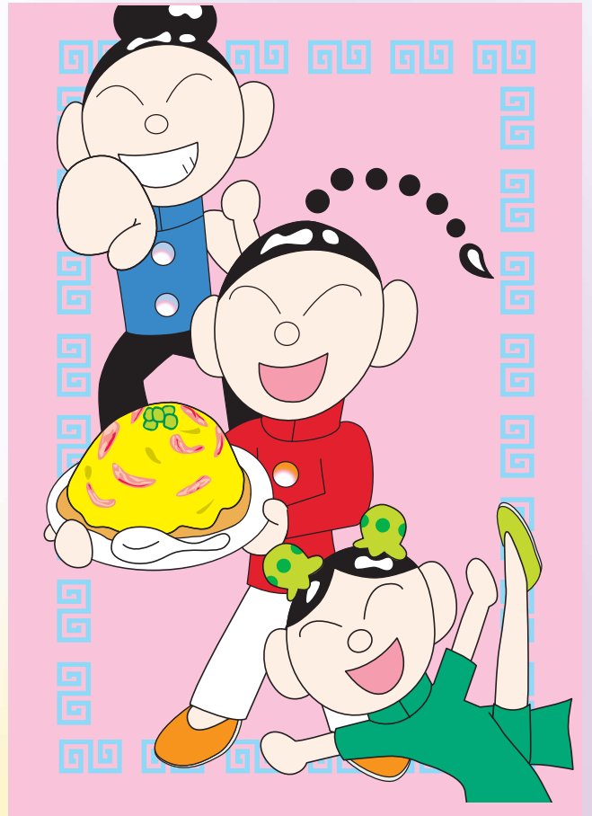
「デン・シン・ハントリオ」 細木 陽平 画