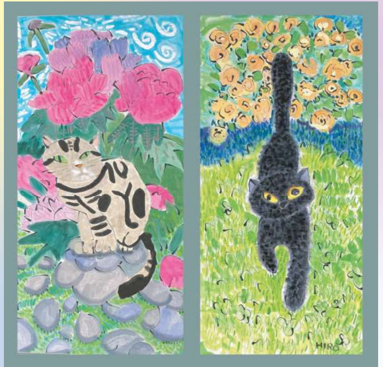
「にゃんちとぶちゃこ」 今田 浩基 画