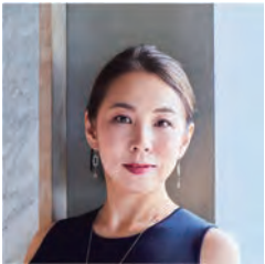
永山 祐子 建築家

1976年 東京都生まれ 2002年 東京都立大学大学院修士課程修了 2002年 メジロスタジオ設立 2013年 リライト_Dに組織改編 現在、日本大学理工学部建築学科准教授